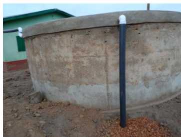
Regenwater Systeem in Yama

In de rondzendbrief van december heeft u reeds kennis kunnen maken met dit project, (drie regenwater opslagsystemen, ieder met een capaciteit van 40.000 liter, voorzien een overloopsysteem voor het overtollige regenwater in Yama, Sirigu en Sandema). Het project is met bijdragen van het Rabo Share4more fonds, de Bennekomse PKN kerken en onze vaste donateurs uitgevoerd en onlangs opgeleverd. In Yama is het dak van de kerk gebruikt voor de opvang van regenwater. (Dit dak is enkele jaren geleden geschonken door de "Brinkstraat Kerk" te Bennekom.)