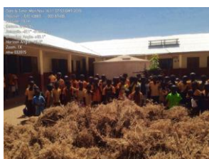
Eerste oogst schooltuin, sojabonen