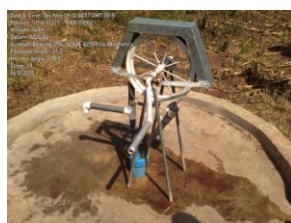
Nieuwe touwpomp Kparipiri